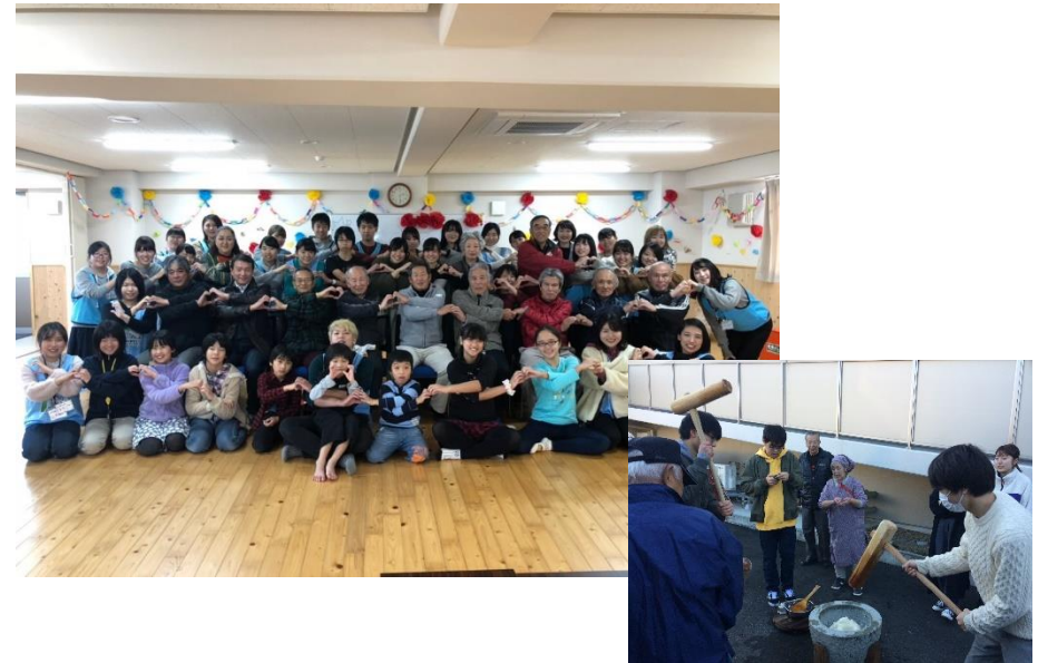
地域学実習Ⅱの成果物