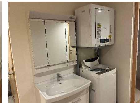
洗面台、洗濯機、乾燥機