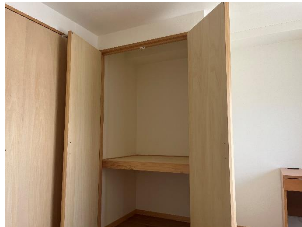
クローゼット 上段：縦120cm×横110cm×奥行75cm 下段：縦70cm×横110cm×奥行75cm