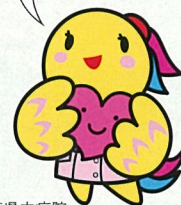
兵庫県立病院 看護師マスコット「あいタン」