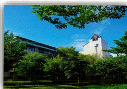
こころの医療センター