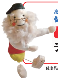
健康長寿センターキャラクター wlc (ウルク)さん