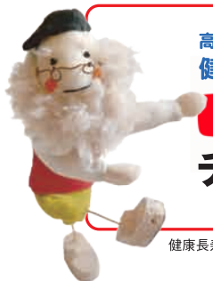
健康長寿センターキャラクター wlc (ウルク)さん