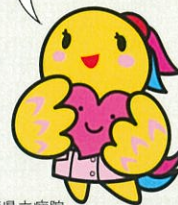
兵庫県立病院 看護師マスコット「あいタン」