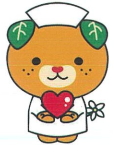
愛媛県イメージアップキャラクター みきやん