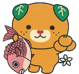
愛媛県イメージアップキャラクター みぎゃん