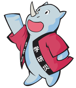
学研災キャラクター サイちゃん