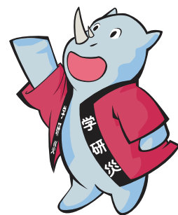
学研災キャラクター サイちゃん