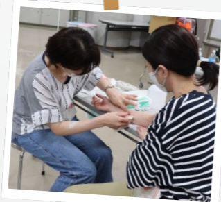
スキンケア・ストーマケア 演習の様子