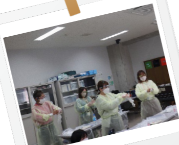
感染管理 演習の様子