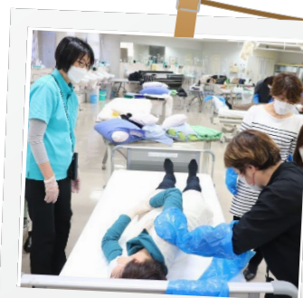
在宅リハビリテーション

研修内容は訪問看護を実践する上で必要な在宅看護と保健医療福祉政策（2科目）、訪問看護概論（2科目）、在宅ケアシステム論（1科目）、訪問看護対象論（2科目）、訪問看護方法論（16科目）を組み合わせたもので、大学の教員や認定・専門看護師などが講義・演習を担当しています。オンラインで受講できる科目もあります。