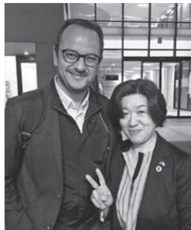
▲徳島市の国際姉妹都市ポルトガル共和国レイリア市長をお迎え

いにカウントダウン。次なるステージに向けて、新しい毎日を楽しみつつ、これまでの自分の経験を次代へと繋いでいきたい、何ができるのか、模索を続けていきたいと思っています。