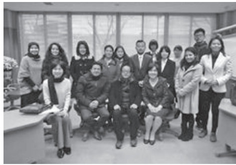
▲ネパールの研究者らとの交流