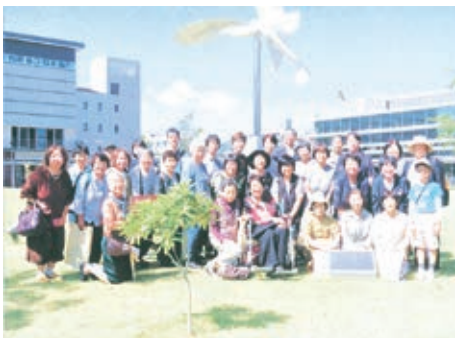
▲風に舞うモニュメント「詩の翼」前にて