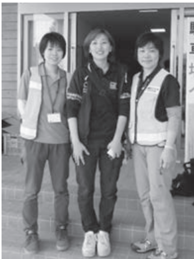
▲平成28年熊本地震の被災地での活動

現在私は、兵庫県立大学地域ケア開発研究所に勤務し、災害看護を専門として研究と教育に従事しています。大学院への進学に合わせて兵庫にきたのは、阪神・淡路大震災から二年が過ぎた一九九七年四月のことでした。当時はまだ街のあちこちに震災の爪痕が残っていました。大学院では専攻した看護管理学に加えて災害看護についても学ぶ機会がありました。とはいえ当時の私は、将来自分が災害看護の研究や教育に携わることになるとは露ほども思っていました。 大学院修了後は教員として大学に残ることに、徐々に災害看護の世界に足を踏み入れていくことになりました。災害が起こると被災地に出かけ、避難所等での支援活動や調査活動に関わるようになりました。活動