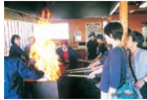
▲カツオのわら焼き体験 かつお船にて