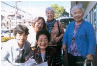
▲永国寺研究棟前にて